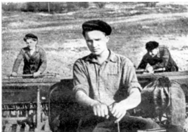
Ученики Шокшанской средней школы на колхозных полях.

В Степановской МТС были организованы краткосрочные курсы для подготовки трактористок и водите-