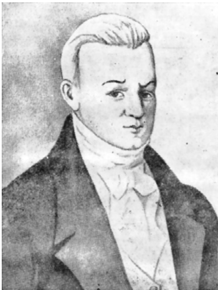
Александр Онисимович Аблесимов.