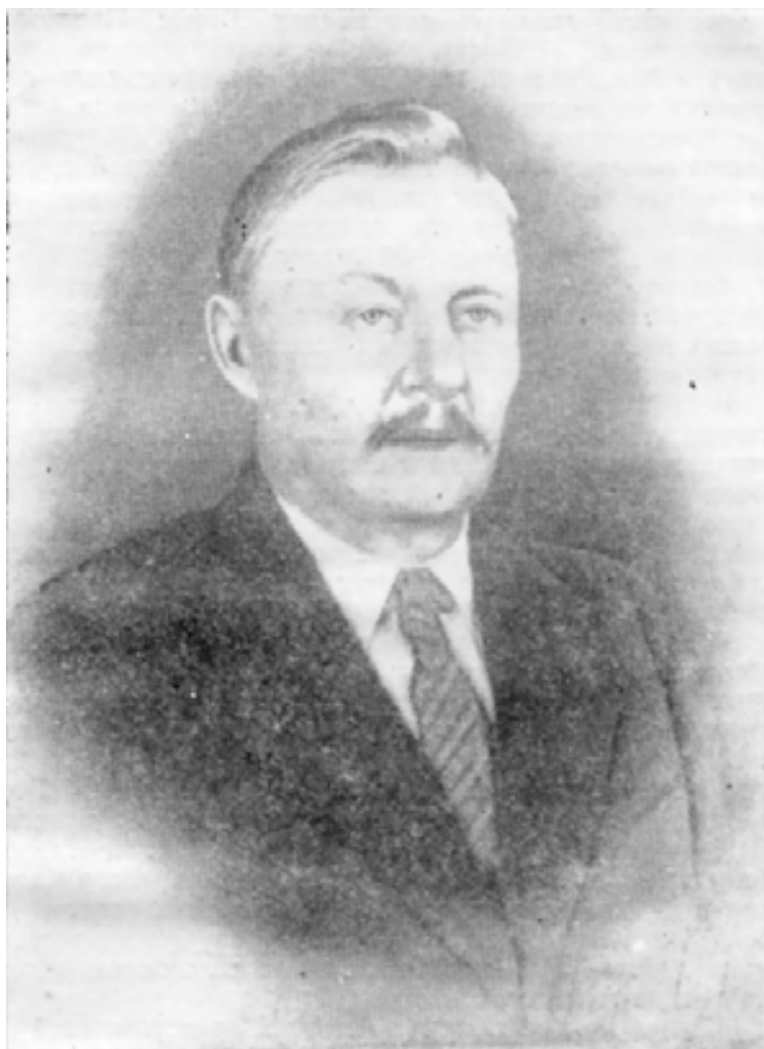
Феодосий Николаевич Красовский.