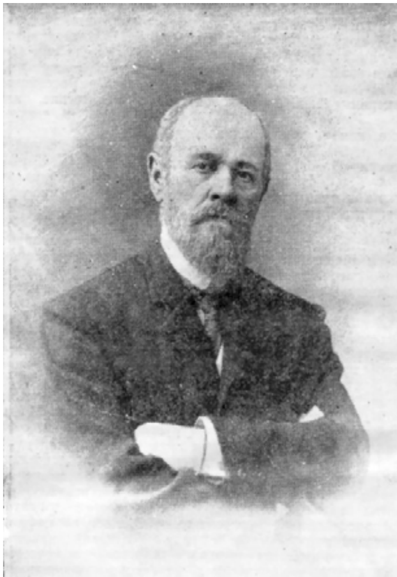
Федор Иванович Успенский.