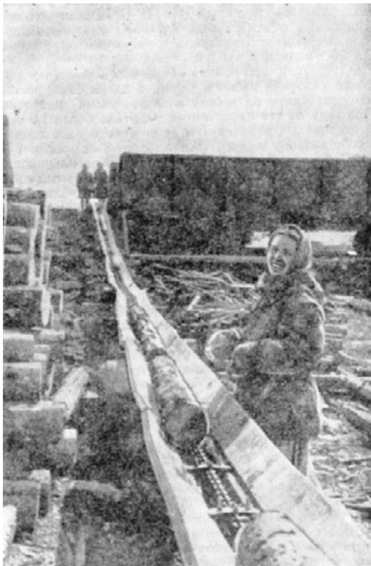
Механизированная погрузка рудстойки на Лопаревском лесопункте.