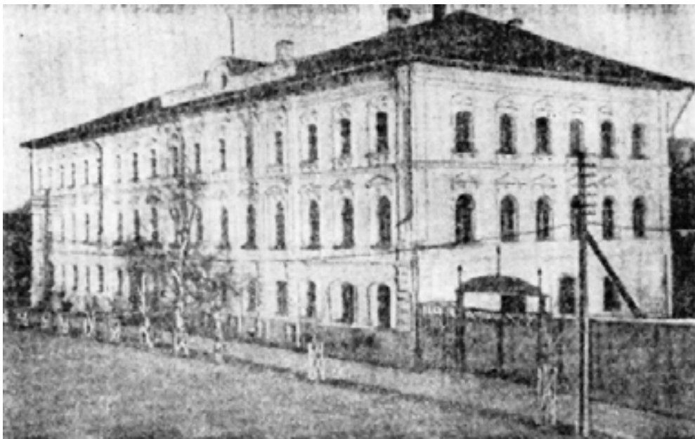
Дом, в котором была провозглашена Советская власть в Галиче. Ныне здание сельхозтехникума.