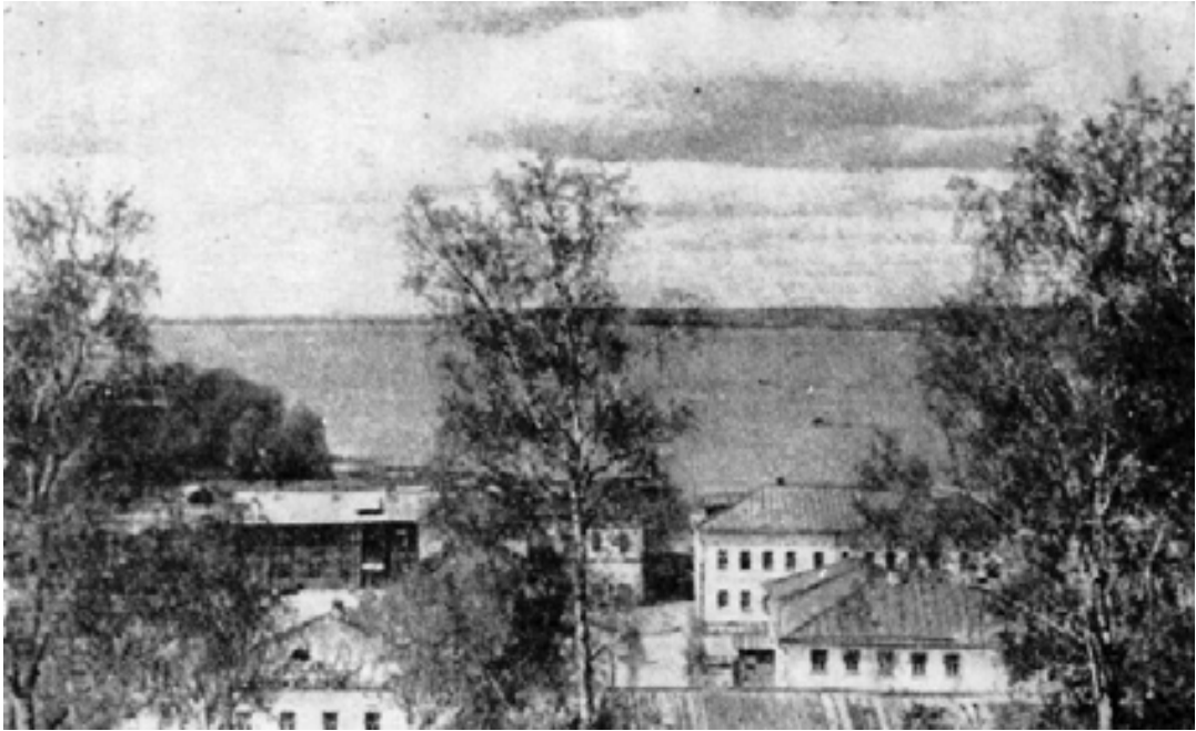
Вид на Галичское озеро со стороны детского дома.