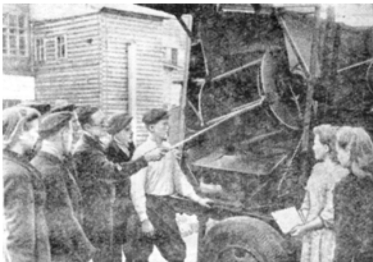
В училище механизации сельского хозяйства.

Большинство учащихся специальных учебных заведений получает стипендии, обеспечено общежитиями, а механизаторы пользуются еще и полным государственным обеспечением.