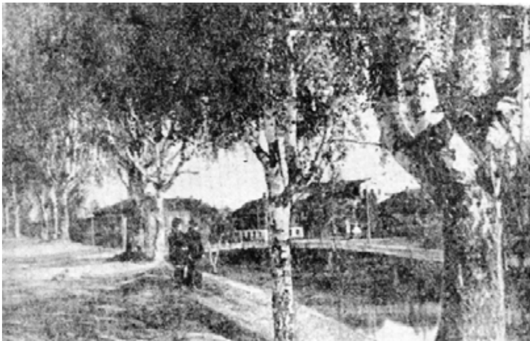
Березовая аллея на старом земляном валу в центре Галича.