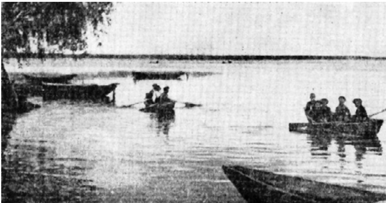
Вечер на Галичском озере.