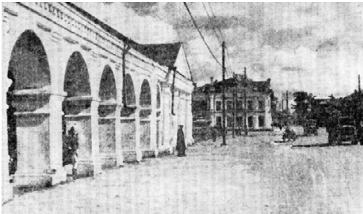
Часть торговых рядов в Галиче.